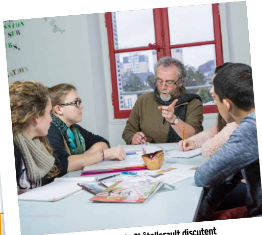
Chaque semaine, les élèves de Châtelleraut discutent de leurs sujets et de leur mise en œuvre, guidés par leur prof.