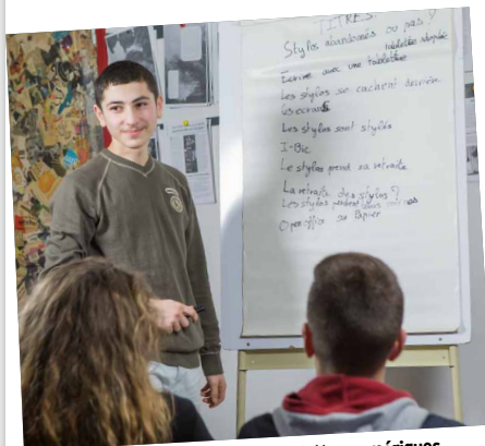
Pour leur article sur l'essor des tablettes numériques, les élèves se creusent la tête pour trouver un bon titre. La première idée est rarement la bonne...