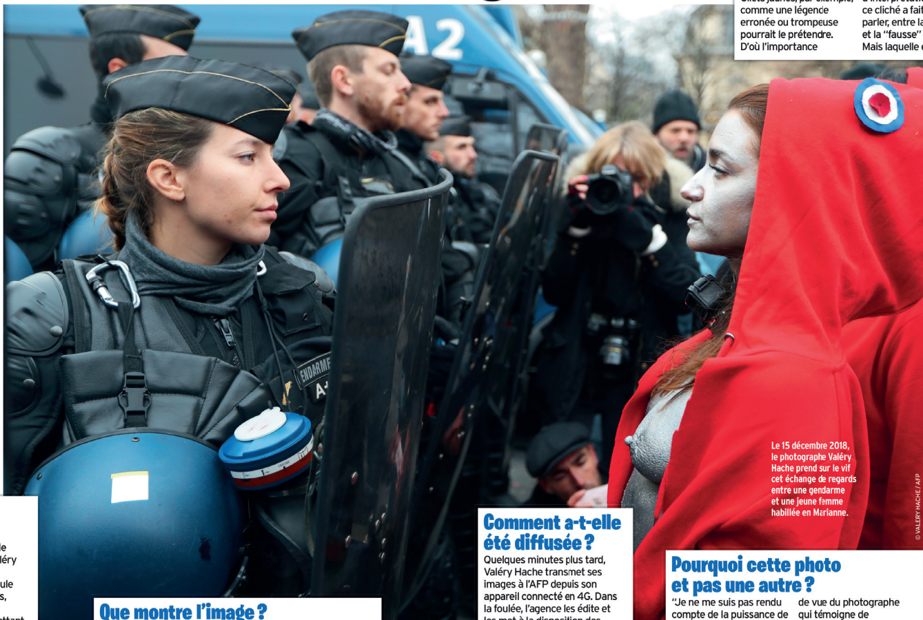
Le 15 décembre 2018, le photographe Valéry Hache prend sur le vif cet échange de regards entre une gendarme et une jeune femme habillée en Marianne.

des infos fournies par l'AFP qui replacent la photo dans son contexte ! Le reste est affaire d'interprétation. D'ailleurs, ce cliché a fait beaucoup parler, entre la "vraie" et la "fausse" Marianne... Mais laquelle est laquelle ?