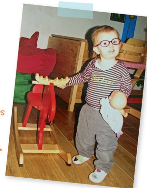
J'ai eu mes premières lunettes à 9 mois. J'ai eu le temps de m'habituer !