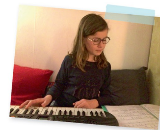
J'adore la musique !

J'avoue qu'en parler dans Astrapi, ça n'est pas facile pour moi. Mais je me dis qu'avec ce portrait, je pourrai peut-être en discuter dans ma classe avec la maîtresse et expliquer plus facilement ce que j'ai. Si les autres savent et connaissent ma maladie, ils comprendront mieux et ne me répéteront pas que mes yeux sont différents.