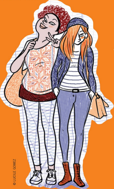
PLUME ET MARY-STONE